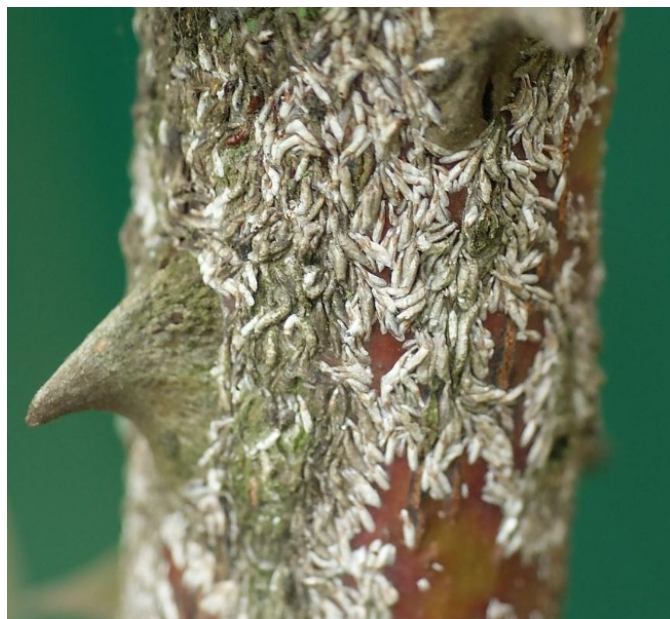
L. japonica kilptäid roosil