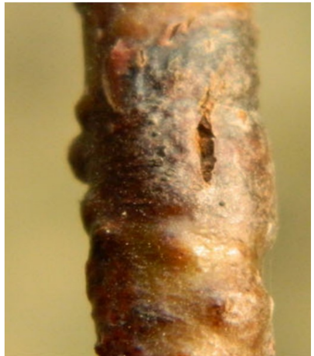
B. kuwatsukai tekitatud tüükad pini oksal