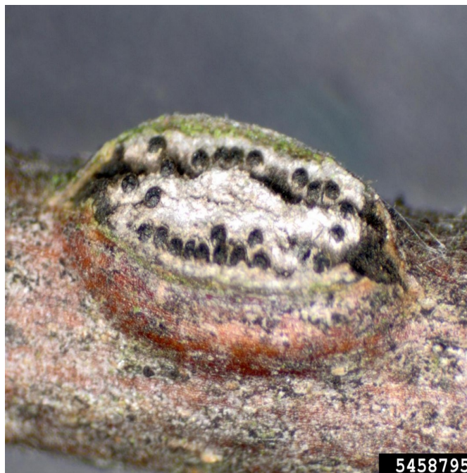
A. anomala viljakeha sarapuu oksal