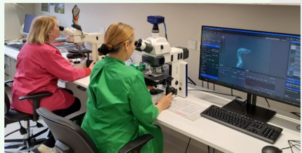
Foto 15. Mikroskopeerimine METKi taimetervise ja mikrobioloogia laboris.

Koostöös teiste teadusasutustega pakub labor meelsasti ka õppuritele praktilist väljaõpet ja huvitavaid uurimisteemasid.