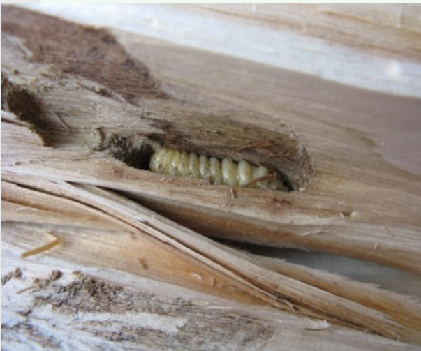
Foto 20. Aasia siku vastne Hiinast pärit kivide transpordipakendis, PTA.

Puidust pakkematerjalile kehtivaid reegleid tasub kindlasti teada, seetõttu tutvustas PTA koostöös ERRiga neid tänavu veebruari lõpus saates Osoon .