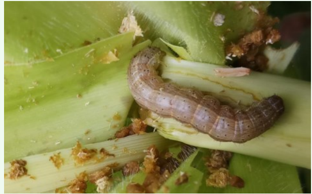
Foto 5. Spodoptera frugiperda vastne toitumas maisi taimel.

pulatsioon suudab talvituda? Kuidas käitub kahjustaja peremeestaimedel, mis ei ole kõige eelistatud? Kui migreeruv võib kahjustaja olla ja kas ta jõuab ka riigi teistesse piirkondadesse? Kõigile neile otsivad asjatundjad praegu vastuseid.