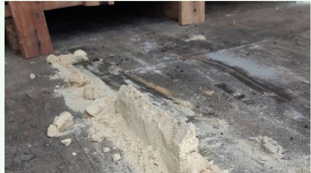
Foto 21. Kahjurputuka Sinoxylon anale näripuru Indiast saabunud kivide konteineri põrandal, PTA.