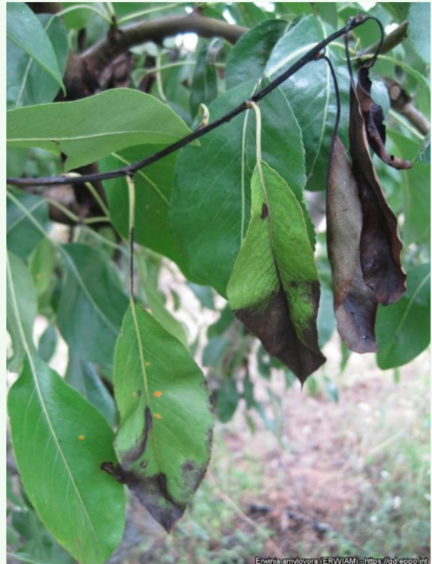
Foto 16. Viljapuu-bakterpõletiku tunnused pirnipuul: lehtede nekroos ja tüüpiline "karjusekepp" võrsetipus, EPPO Global Database.

Nakatunud õuna- ja pirnipuudel ilmnevad esimesed sümptomid kevadel niiske ilmaga, kui keskmine