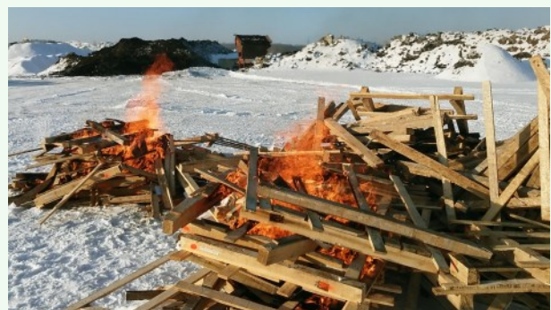
Foto 23. Nõuetele mittevastava puidust pakkematerjali põletamine, PTA.