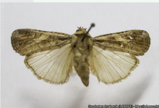
Foto 4. Spodoptera frugiperda , Regina Sugayama (Agropec), EPP0 Global Database.

Kreekas on S. frugiperda leviku tõttu kõige enam ohustatud mandriosas paiknevad puuvilla- ja maisipõllud; probleemiks on kahjuri resistentsus pestitsiididele. Moodustatud on viis piiritletud ala – Lesbos, Kreeta, Laconia, Attica ja Evoia –, mille ümbruses on 60 km raadiune puhvertsoon.