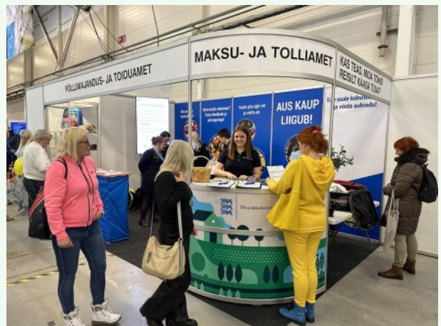
Foto 14. PTA ning Maksu- ja Tolliameti ühine teavitustöö Tourest 2024 messil

Nagu eelnevatel aastatel, oli ka seekord boksi suurim tõmbenumber kohvimäng. See õpetas, millised piirangud kehtivad taimede, puu- ja köögiviljade, seemnete, toiduainete ja muude kaupadega reisimisel ehk mida välisreisilt Euroopa Liitu naastes mitte kaasa võtta.