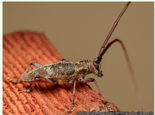
Foto 3. Männi-laguussi vektorputukas Monochamus spp.