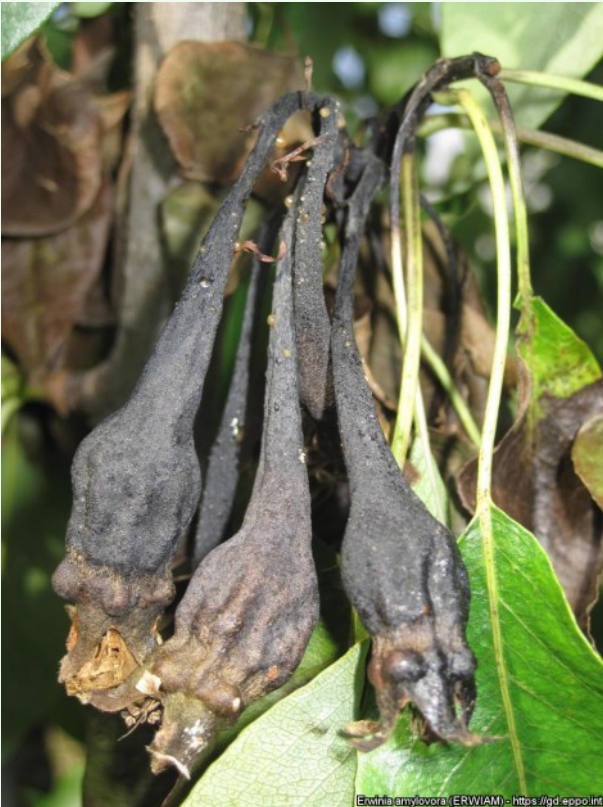
Foto 17. Viljapuu-bakterpõletiku tunnused pirnipuul: mumifitseerunud toored viljad, EPPO Global Database.

Külm ilm vähendab edasikandumise tõenäosust ja edasikandumist ei pruugi toimuda. Haigus võib olla latentne. See tähendab, et haigustekitaja on taimel, kuid soodsate ilmastikutingimuste puudumisel sümptomeid ei ilmne. Kui nakatumisjärgsed keskkonnatingimused ei ole bakterite paljunemiseks soodsad, võib Erwinia amylovora rakkude arv olla väga madal.