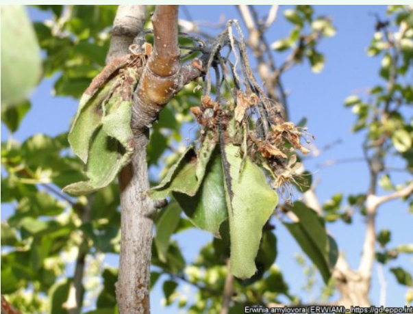
Foto 18. Viljapuu-bakterpõletiku tunnused pirnipuul: nekrootilised õied, Hamid Abdollahi, EPPO Global Database.