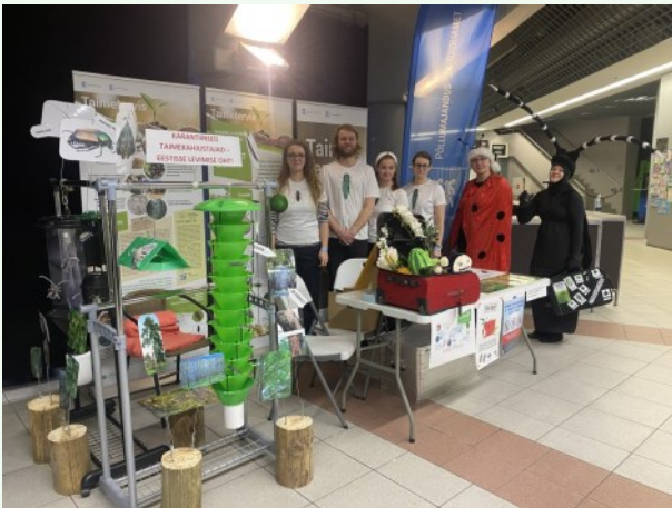
Foto 11. Karantiinsete putukate tutvustamine Unibet Arenal Lotte jõuluetendusel 2023. aastal.

Mullu 7.–10. detsembrini tutvustas Põllumajandus- ja Toiduamet koostöös Regionaal- ja Põllumajandusministeeriumiga Tallinnas Unibet Arenal etenduse „Lotte ja kadunud jõuluvana“ vaheaegadel ja enne etenduste algust taimedele ohtlikke putukaid.