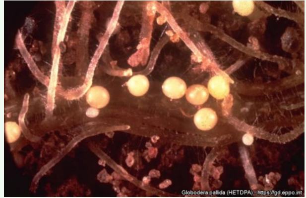
Foto 7. Valkja kartuli-kiduussi tsüstid, Central Science Laboratory, York (GB), EPPO Global Database.

Võimaliku saastumise allikana kahtlustatakse teistest Euroopa Liidu liikmesriikidest pärit sertifitseeritud seemnekartulit, mis on aga murettekitav teadmine.