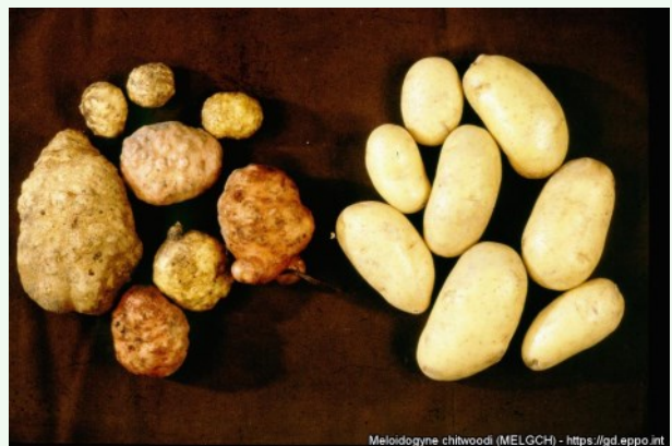
Foto 6. Pahknematoodi Meloidogyne chitwoodi kahjustusega kartulimugulad (vasakul) ja terved mugulad (paremal), EPP0 Global Database.

Võimalikke saastumisallikaid uuritakse; saastunud põld paiknes ettevõtte teistest põldudest eemal.