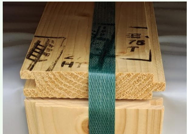
Foto 22. Loetamatu vastavusmargistus puidust pakkematerjalil, PTA.