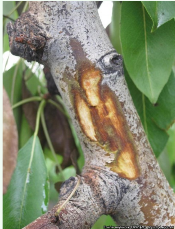
Foto 19. Viljapuu-bakterpõletiku tunnused pirnipuul: iseloomulikud punased triibud tüvel koore all, EPPO Global Database.