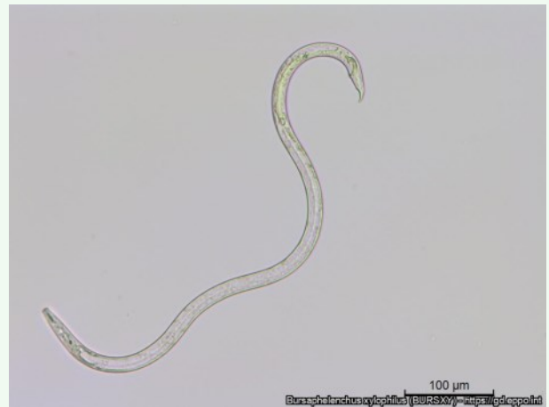
Foto 2. Nematood männi-laguuss, David Pires (INIAV, PT), EPPO Global Database.

lisaks saastunud puude ning nende ümber 100 meetri raadiuses kasvavate okaspuude mahavõtmisele tuleb seiret veelgi intensiivistada, et avastada võimalikke uusi koldeid.