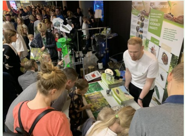
Foto 13. Taimetervise teemaline väljapanek Unibet Arenal Lotte jõuluetendusel.

Tänavu 8.–10. veebruarini oli Põllumajandus- ja Toiduamet turismimesil Tourest koos Maksu- ja Tolliametiga väljas ühisstendiga, et tutvustada reisi- ja pagasiga seotud keelde ja piiranguid.